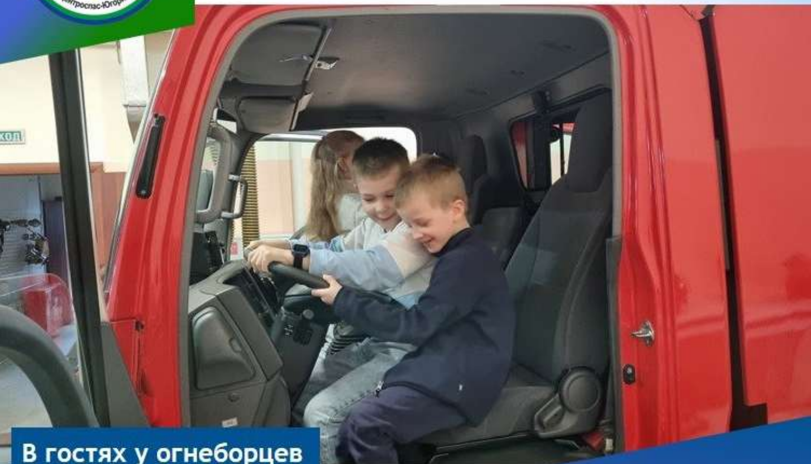
В гостях у огнеборцев

Междуреченские огнеборцы всегда с радостью принимают гостей. На этот раз пожарную часть посетили сразу два класса междуреченской средней общеобразовательной школы. Ребята с неподдельным интересом осматривали боевое снаряжение и пожарную машину.