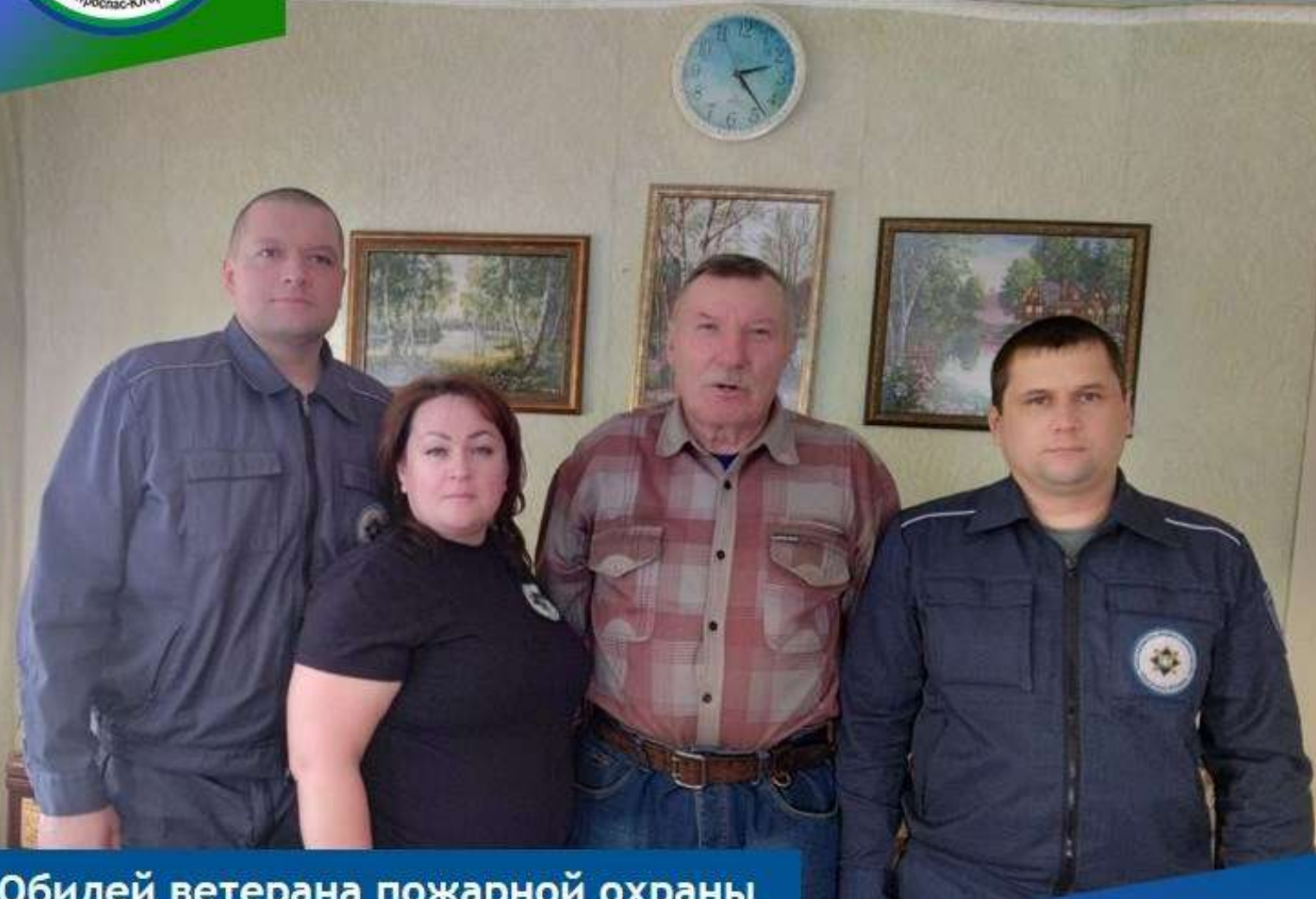
Юбилей ветерана пожарной охраны