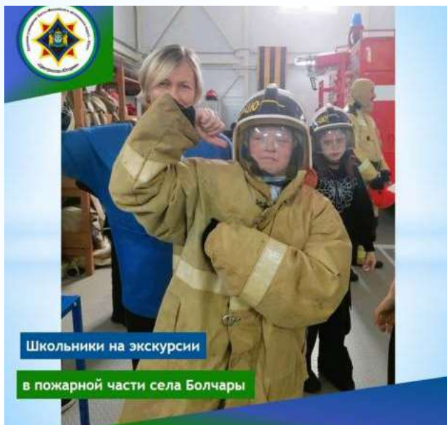
Школьники на экскурсии

В ходе экскурсии работники Центроспаса обсудили с ребятами основные причины пожаров, вспомнили правила пожарной безопасности.